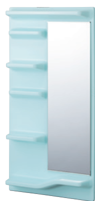
ウォーターブルー